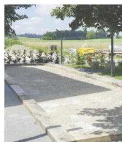
3 Piste de pétanque