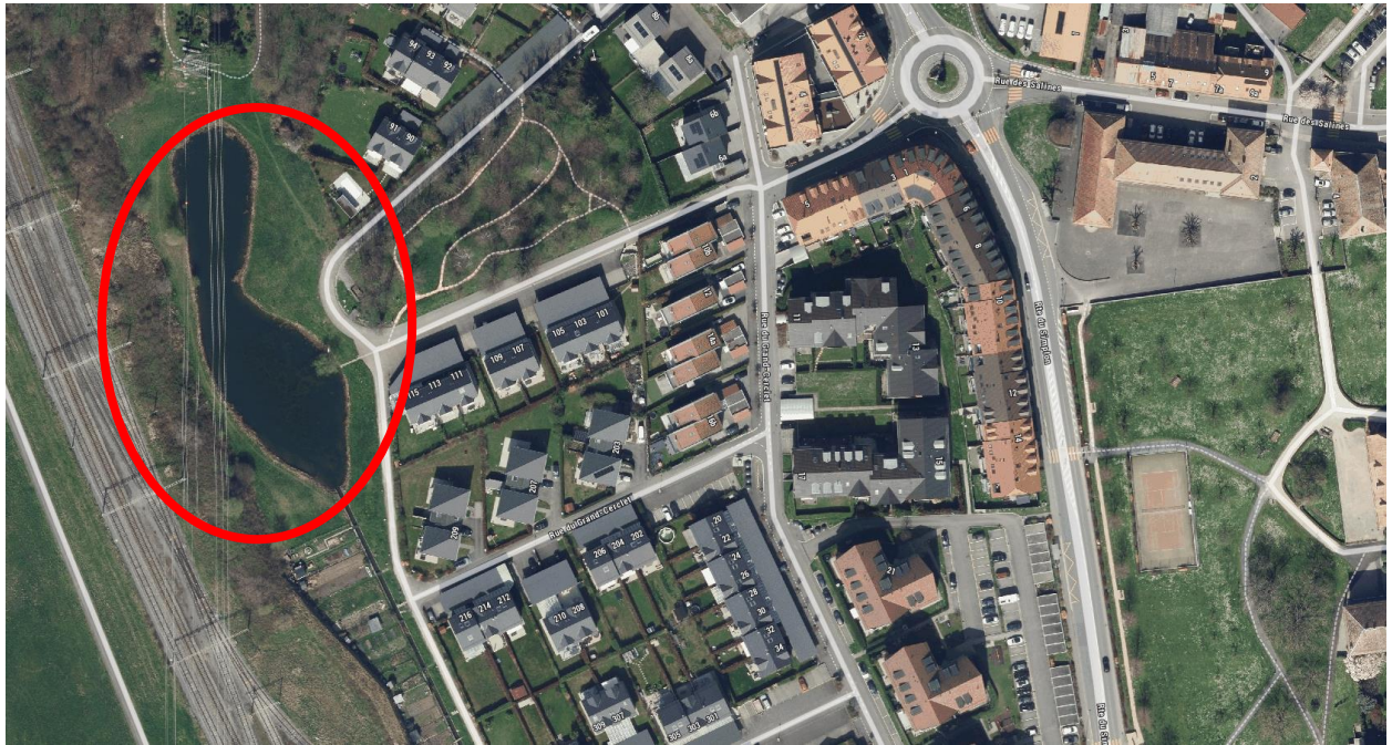
Plan de situation Etang du Grand Cerclet parcelle 169