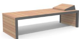
4 Mobilier de détente