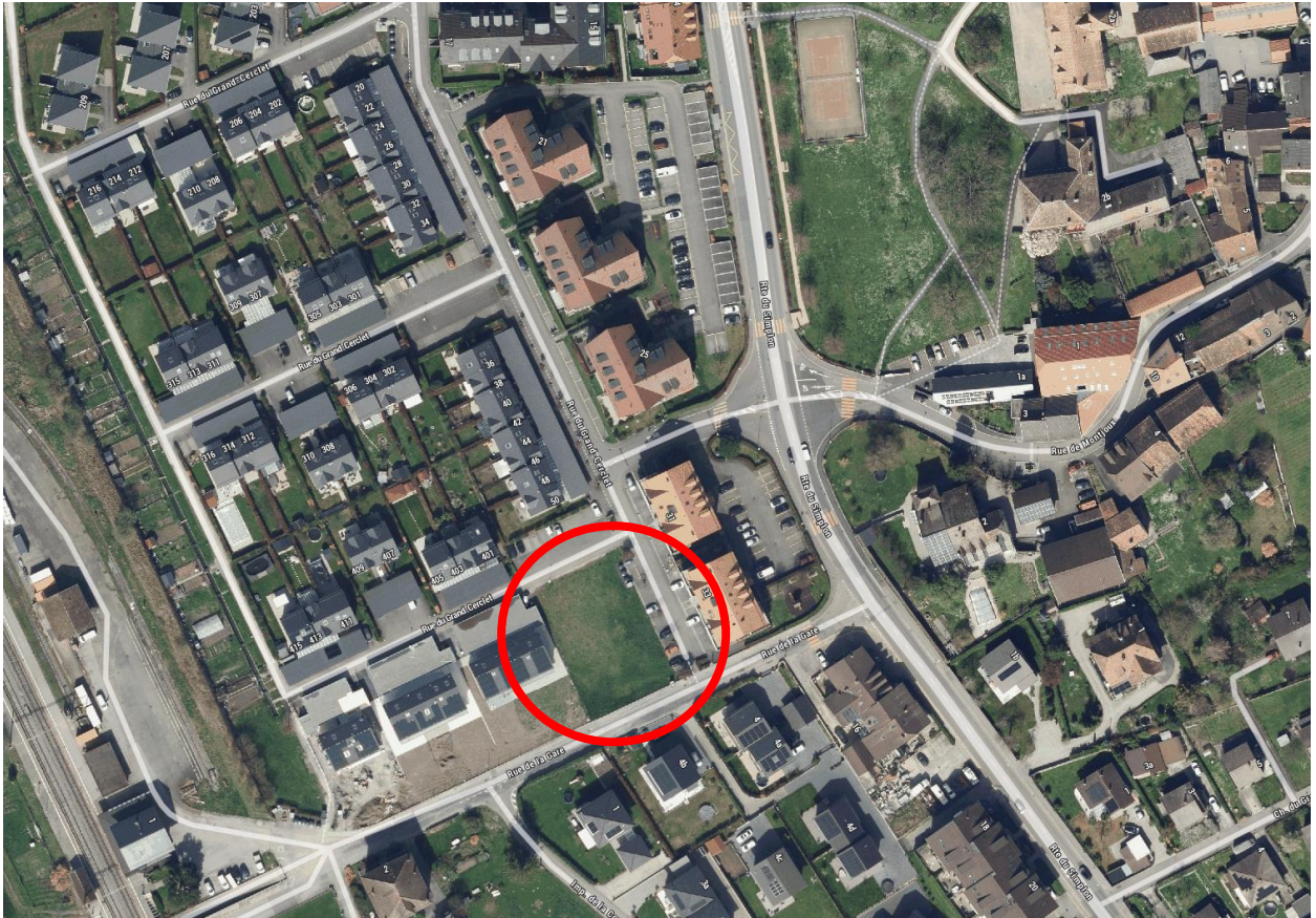
Plan de situation de la parcelle 919 de 1343m 2